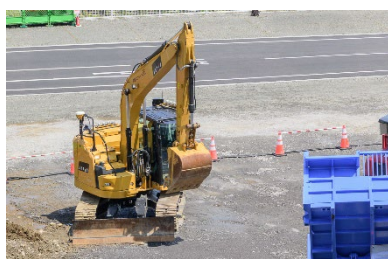
ラジコン対応型バックホー

アクティオは、遠隔操作で作業の安全性と効率を高めるさまざまな機械を提供しています。「ラジコン対応型バックホー」は、マシンコントロール仕様のバックホーとラジコンによる遠隔操作を組み合わせたもので、遠隔操作で課題とされていた精度の高い施工を実現。災害復旧や危険な場所での作業に最適です。「ハイブリッドラジコン草刈機 神刈」は、小型でパワーがあり、草刈りはエンジン、移動はモーターで動くハイブリッド方式です。また、操作が簡単で初心者でも扱いやすい草刈機です。「バッテリー式運搬車」は、階段や傾斜のある場所でも最大 500kg、平地では 1,000kg の荷物を運べる運搬車で、排気ガスが出ないため屋内でも安心して使えます。狭い場所でもスムーズに動かせるのも特長です。