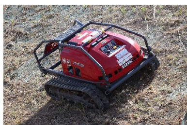
ハイブリッドラジコン草刈機 神刈