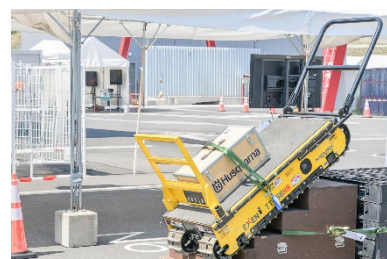
バッテリー式運搬車