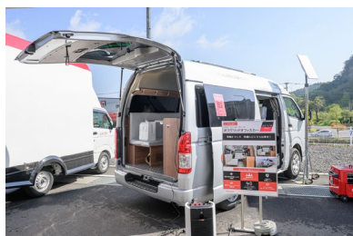
オフグリッドオフィスカー