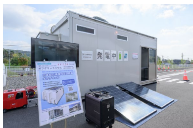
オフグリッドハウス

アクティオは、防災・減災対策に貢献する様々な商品を提供しています。太陽光発電と蓄電システムを備えた「オフグリッドハウス」は、商用電源に頼らず電力を自給できる自立型ユニットハウスで、建設現場や災害時の仮設オフィス、熱中症対策用の休憩所として幅広く活躍します。また、太陽光パネルと大容量バッテリーを搭載した「オフグリッドオフィスカー」は、移動可能な快適作業空間を提供します。ソフトバンク社と連携した通信サービス「Starlink Business」は、SpaceX 社の低軌道衛星を活用することで、通信インフラが未整備な場所でも高速かつ安定したインターネット接続を実現し、あらゆる現場を支援します。